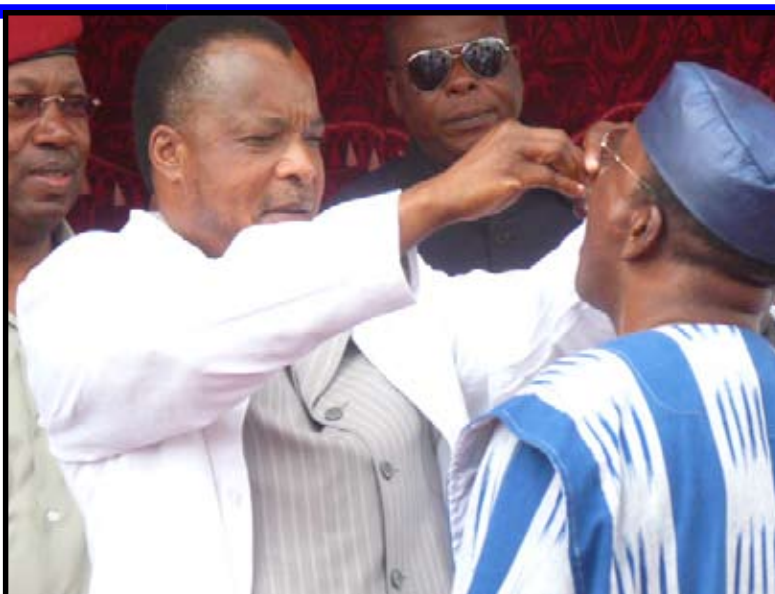
... Le Préfet du Département de Brazzaville...

La campagne nationale de vaccination accélérée lancée ce matin à Brazzaville et dans les autres Départements de la République du Congo, s'effectuera en trois passages: i) du 18 au 22 novembre 2010; ii) du 03 au 07 novembre 2010 et, iii) du 26 au 30 novembre 2010.