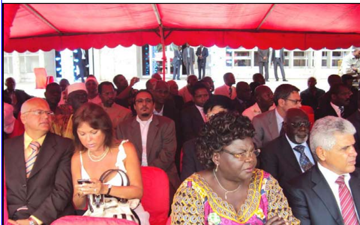
Une vue des invités à la cérémonie

M. Boniface BIBOUSSI, HIP/OMS-Congo biboussib@cg.afro.who.int