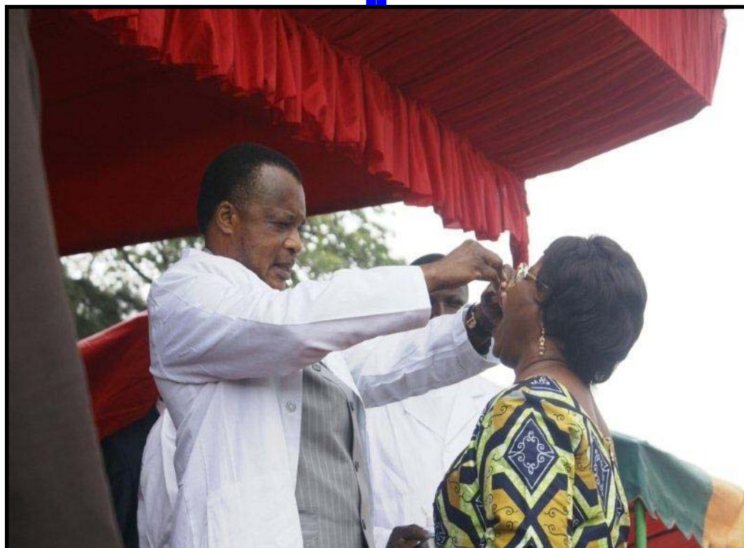
... la Ministre de la Promotion de la Femme au Développement...

partenaires et notamment le Rotary International, a insisté sur la prise en compte par la campagne de mobilisation sociale, de la promotion des