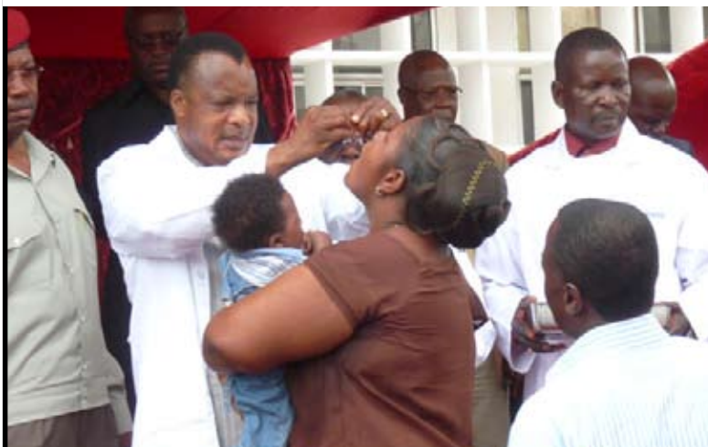
... sa mère...