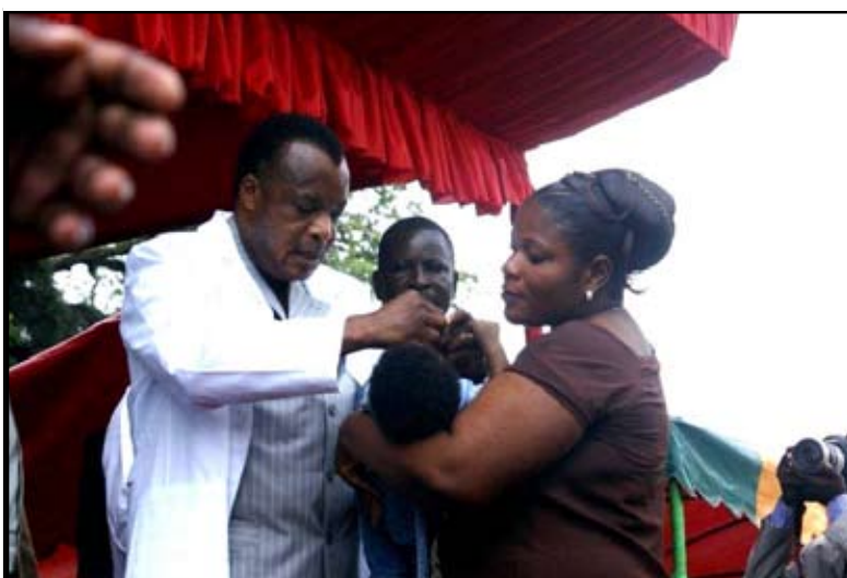
... un enfant...