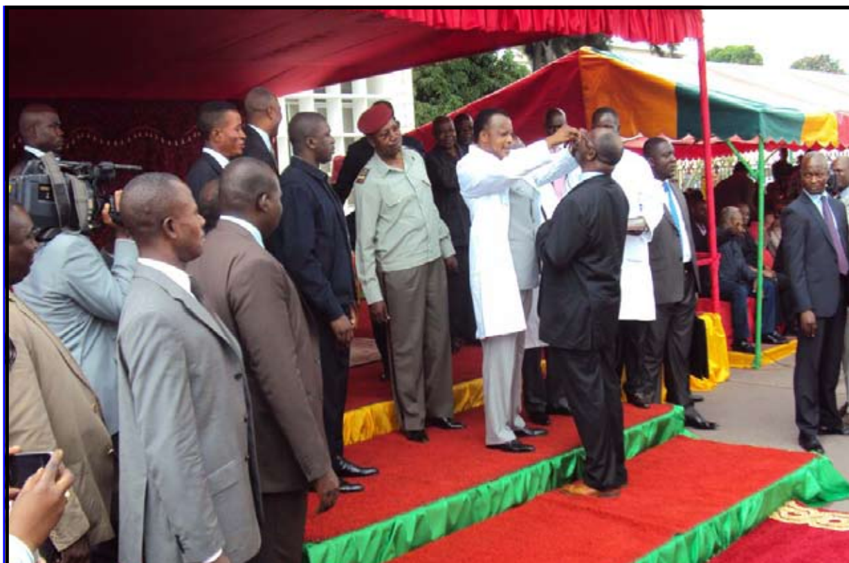
... et l'Archevêque de l'Archidiocèse de Brazzaville!

VISION DE L'OMS POUR LE CONGO : « UN DÉVELOPPEMENT SANITAIRE MAÎTRISÉ, À MÊME DE PRODUIRE DES SERVICES PERFORMANTS À MOINDRE COÛT, EN PARTICULIER POUR LES POPULATIONS CONGOLAISES LES PLUS PAUVRES ET LES PLUS VULNÉRABLES »