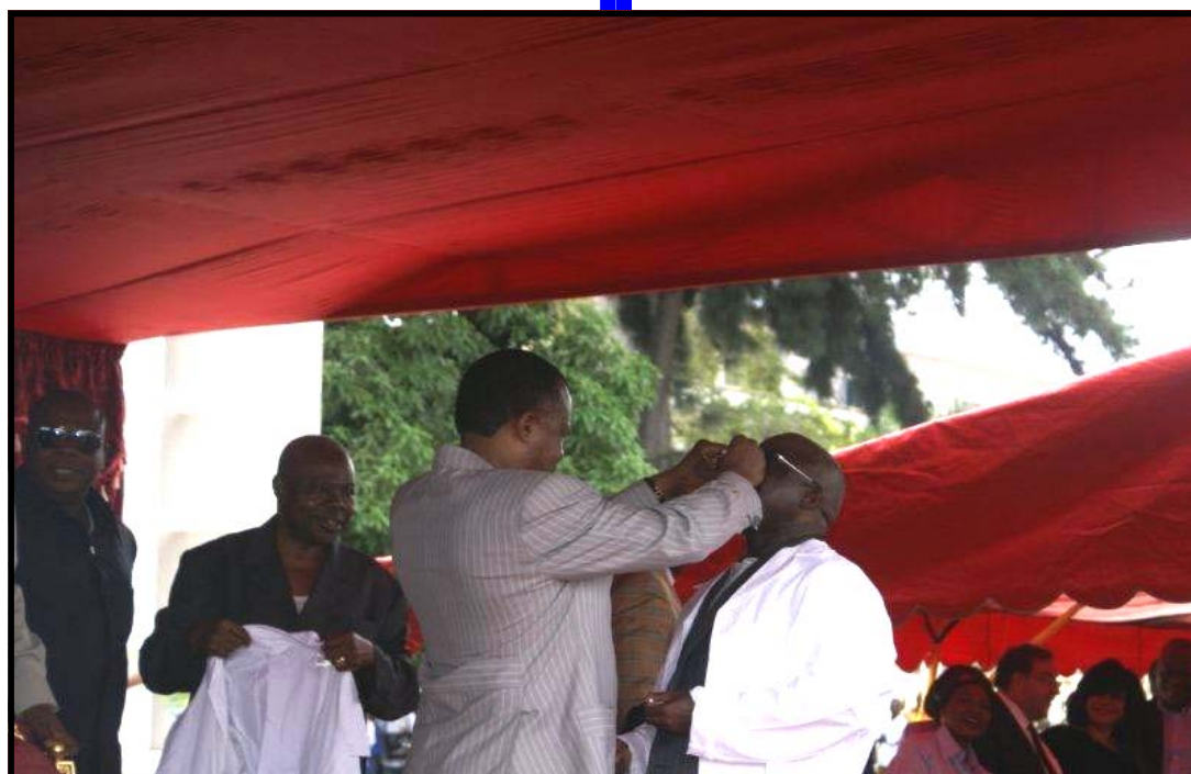
Le Président de la République vaccinant le Ministre de la Santé et de la Population...

la République et le Gouvernement présentent aux familles endeuillées, l'expression de leurs condoléances les plus attristées ainsi que leur vive com-